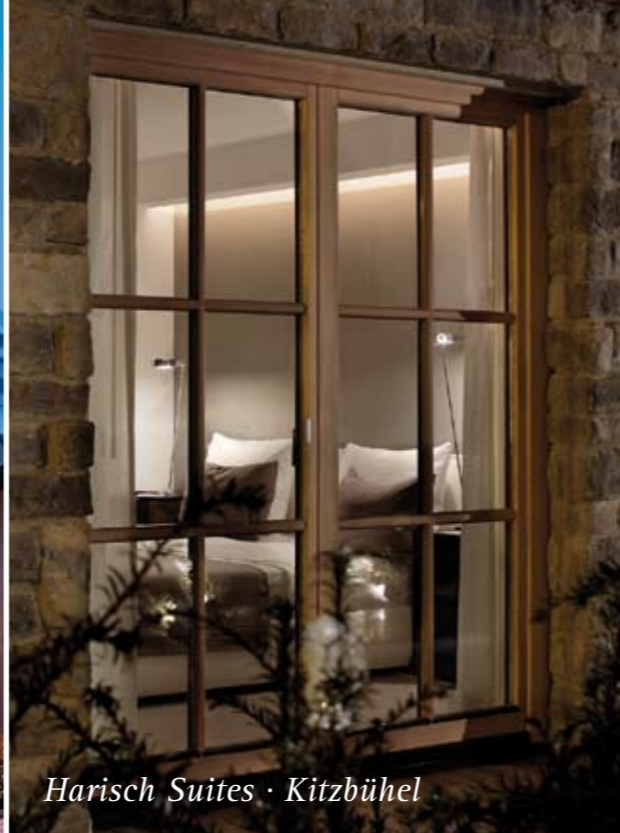
Harisch Suites · Kitzbühel