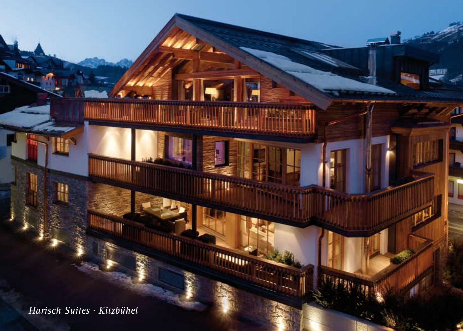
Harisch Suites · Kitzbühel