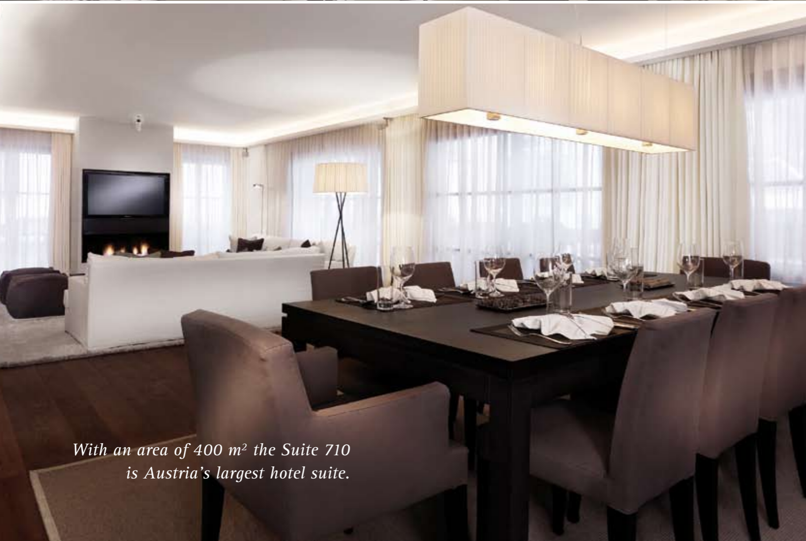
With an area of 400 m 2 the Suite 710 is Austria's largest hotel suite.