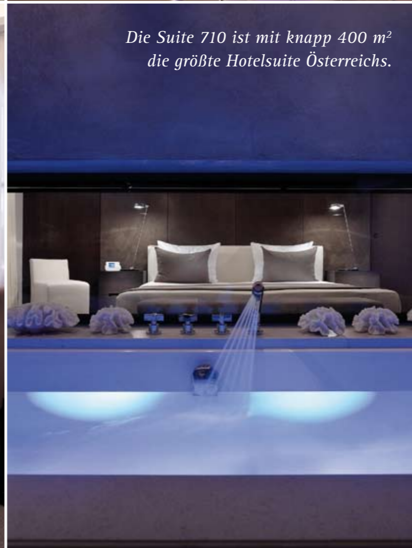
Die Suite 710 ist mit knapp 400 m 2 die größte Hotelsuite Österreichs.